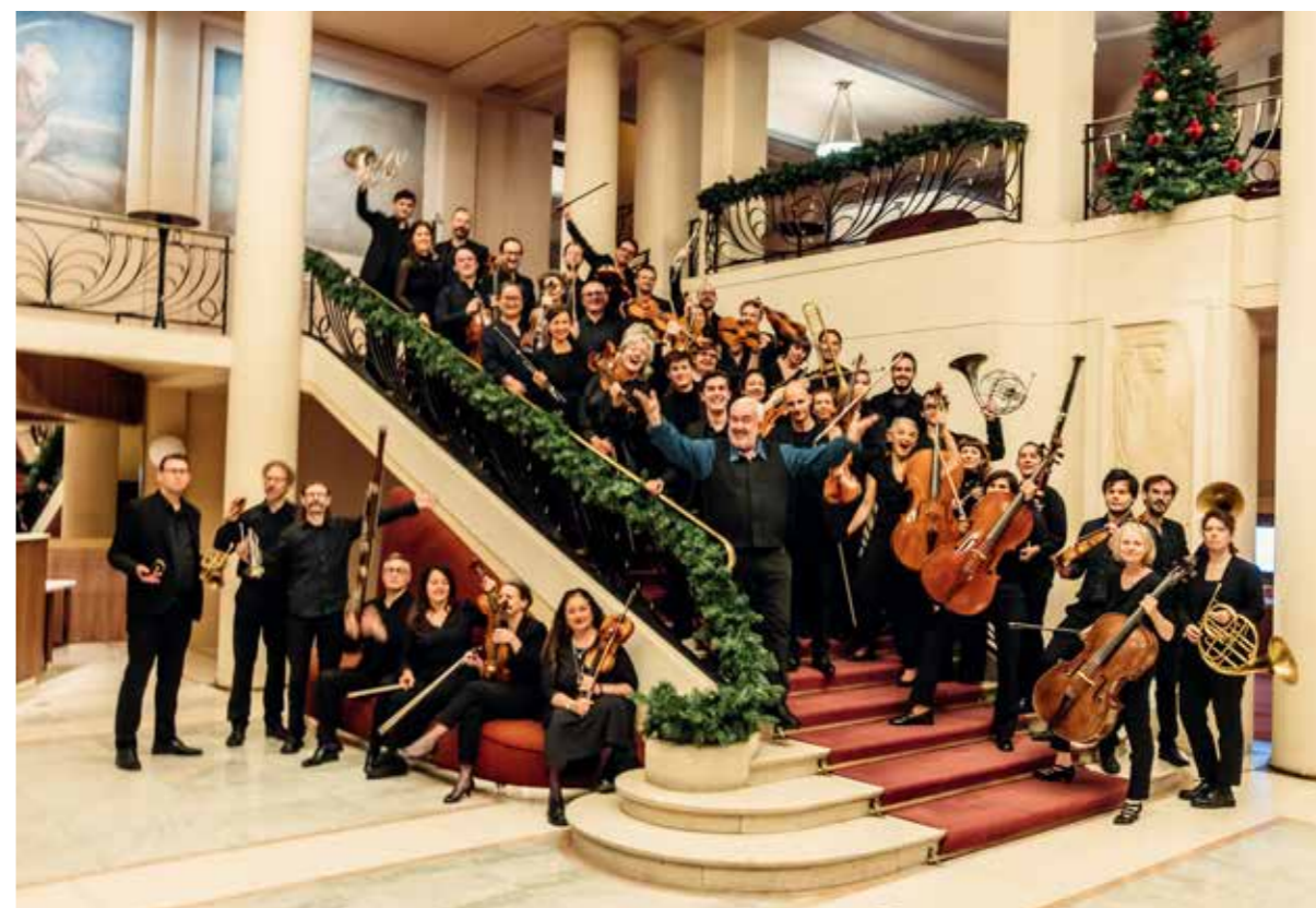
Handel, Les Musiciens du Louvre e Marc Minkowski