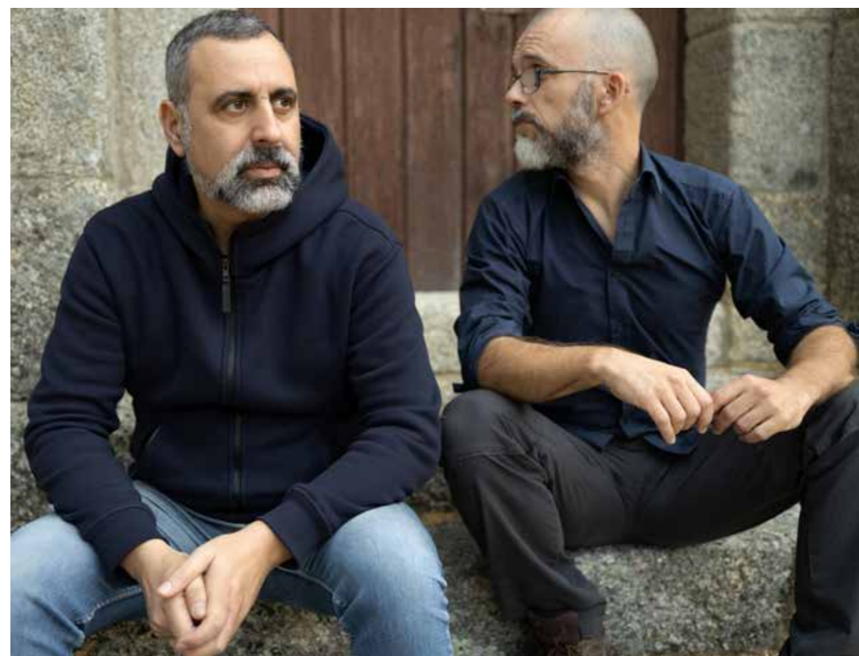
Cancioneiro de Elvas, Sete Lágrimas