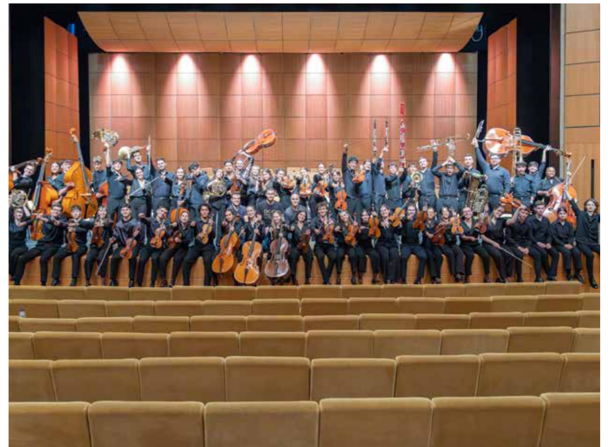
Sinfonia n.º 5 de Mahler, Jovem Orquestra Portuguesa e Orquestra de Câmara Portuguesa