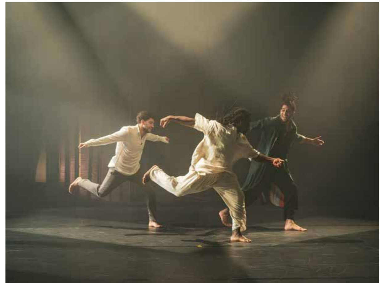
Ka-In, Groupe Acrobatique de Tanger