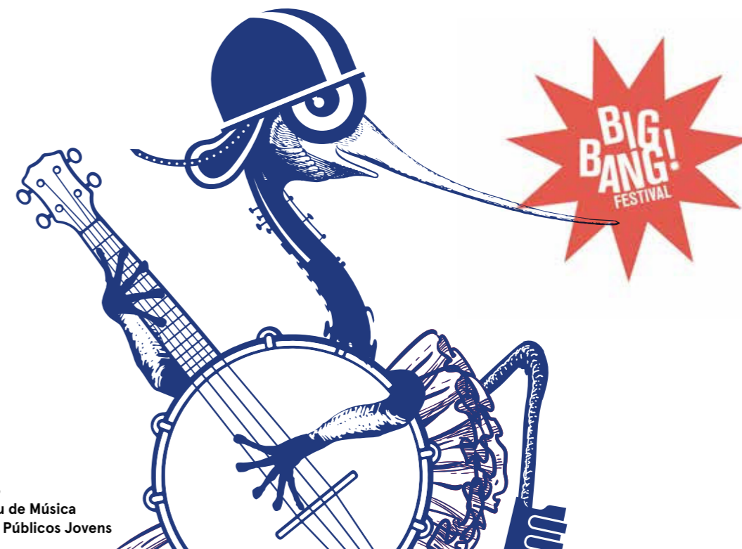
BIG BANG LX 26 Festival Europeu de Música e Aventura para Públicos Jovens

O CCB abre a porta a dois quartos onde vivem músicos do BIG BANG. Vamos poder visitar os seus imaginários fantásticos, conhecer estes universos e viver propostas de aventura, que, para já, os músicos querem manter em segredo.