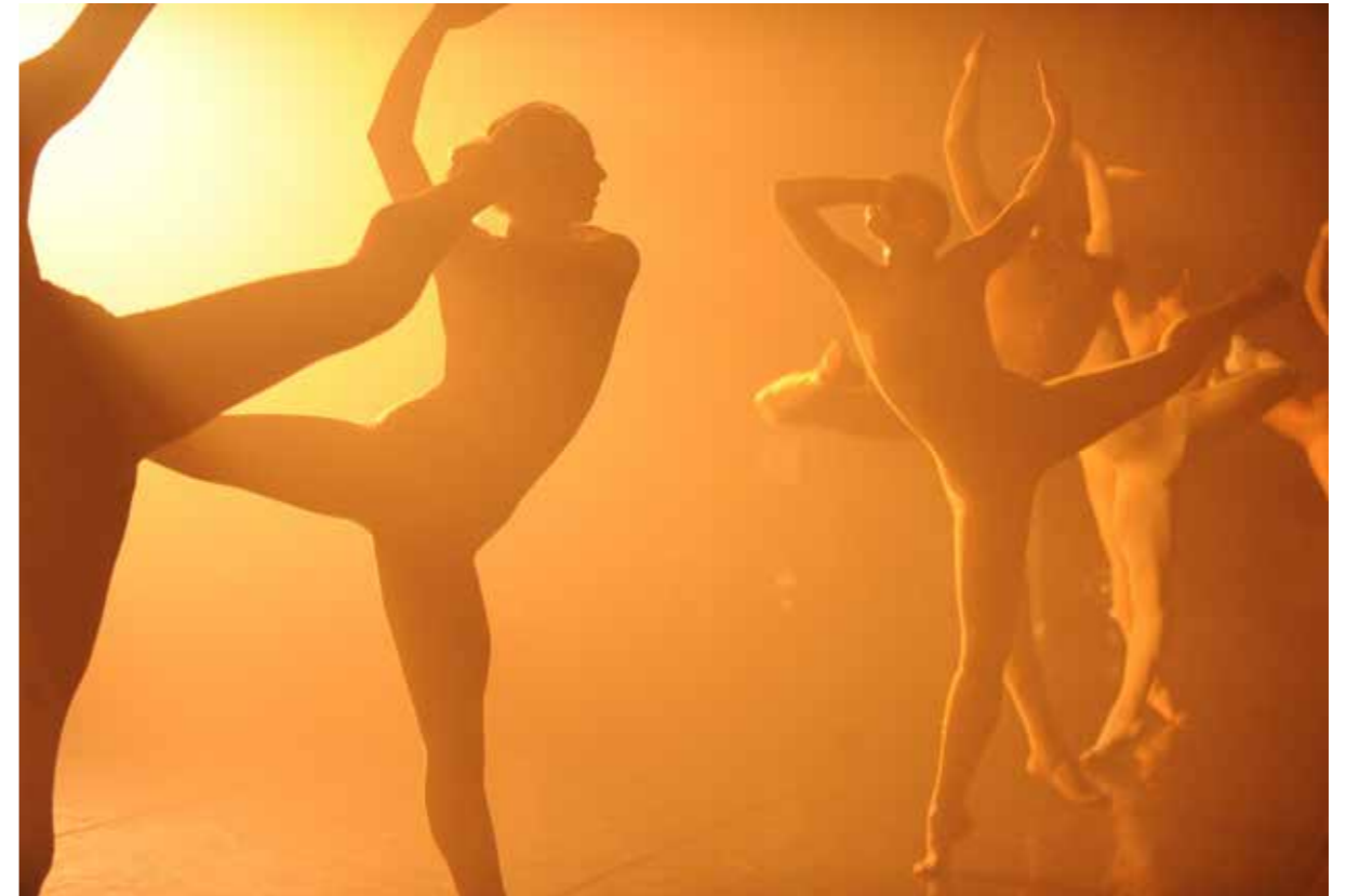
House de Sharon Eyal + Sagração da Primavera de Mats Ek, Ballet de L'Opéra de Lyon