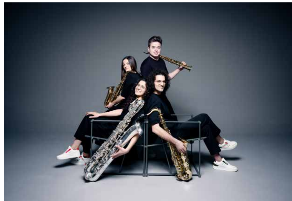
Músicas da Revolução , Maat Saxophone Quartet