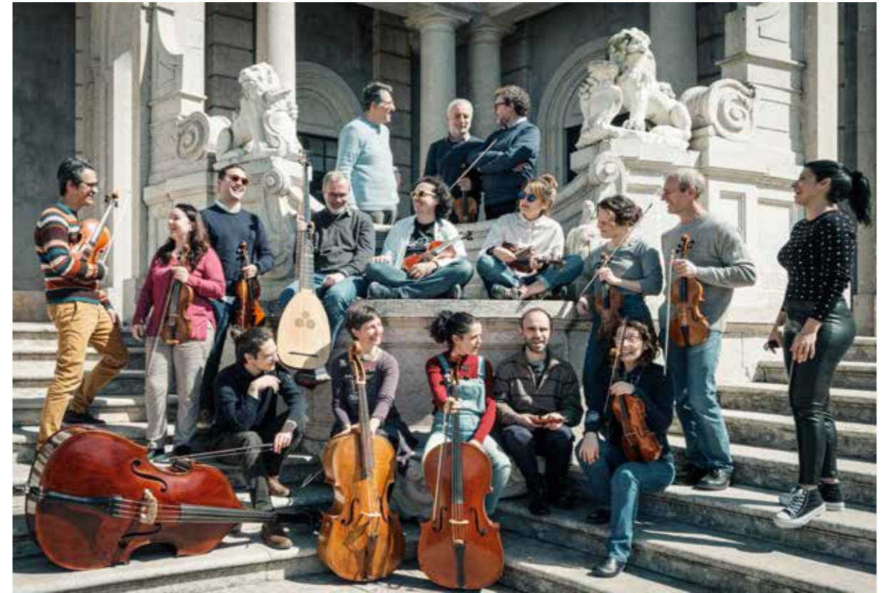
Ad Gloriam Dei : Cantatas de Bach, Scarlatti e Stradella, Divino Sospiro