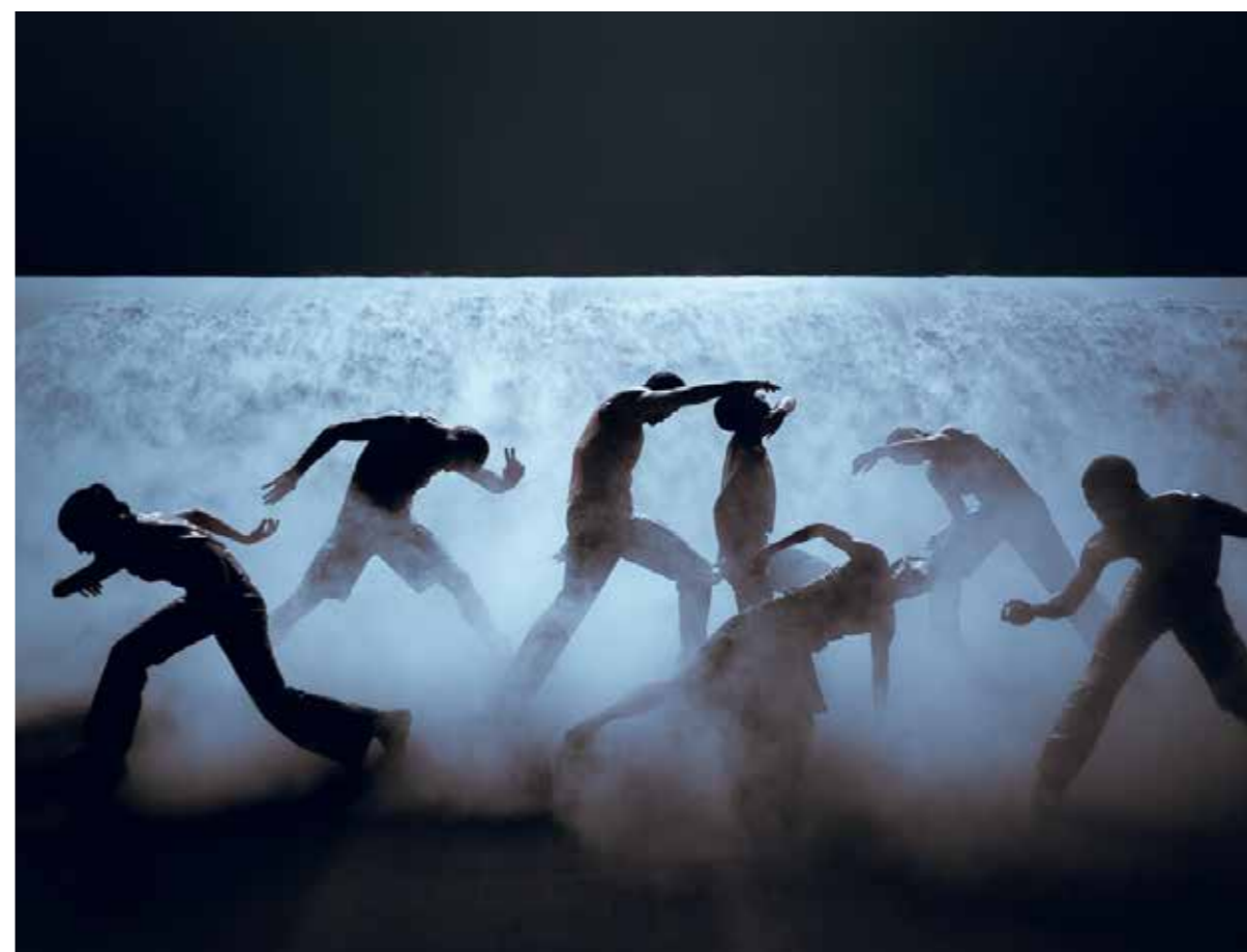
Mirage de Damien Jalet e Kohei Nawa, Ballet du Grand Théâtre de Genève