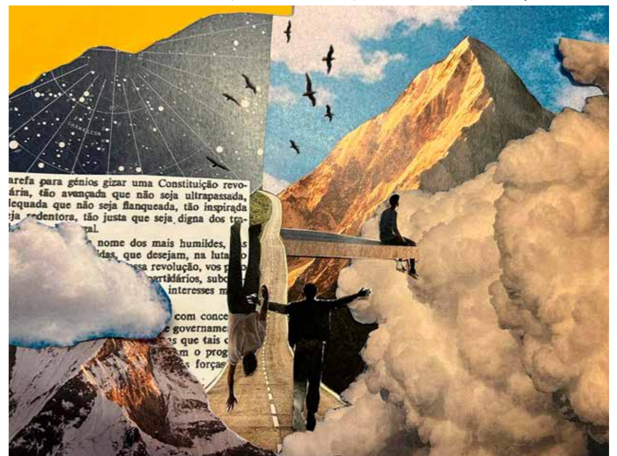
PROGRAMA MISSÃO: DEMOCRACIA Montanha e Utopia , Sara Barros Leitão, a partir de Montanha e Utopia de Gonçalo M. Tavares