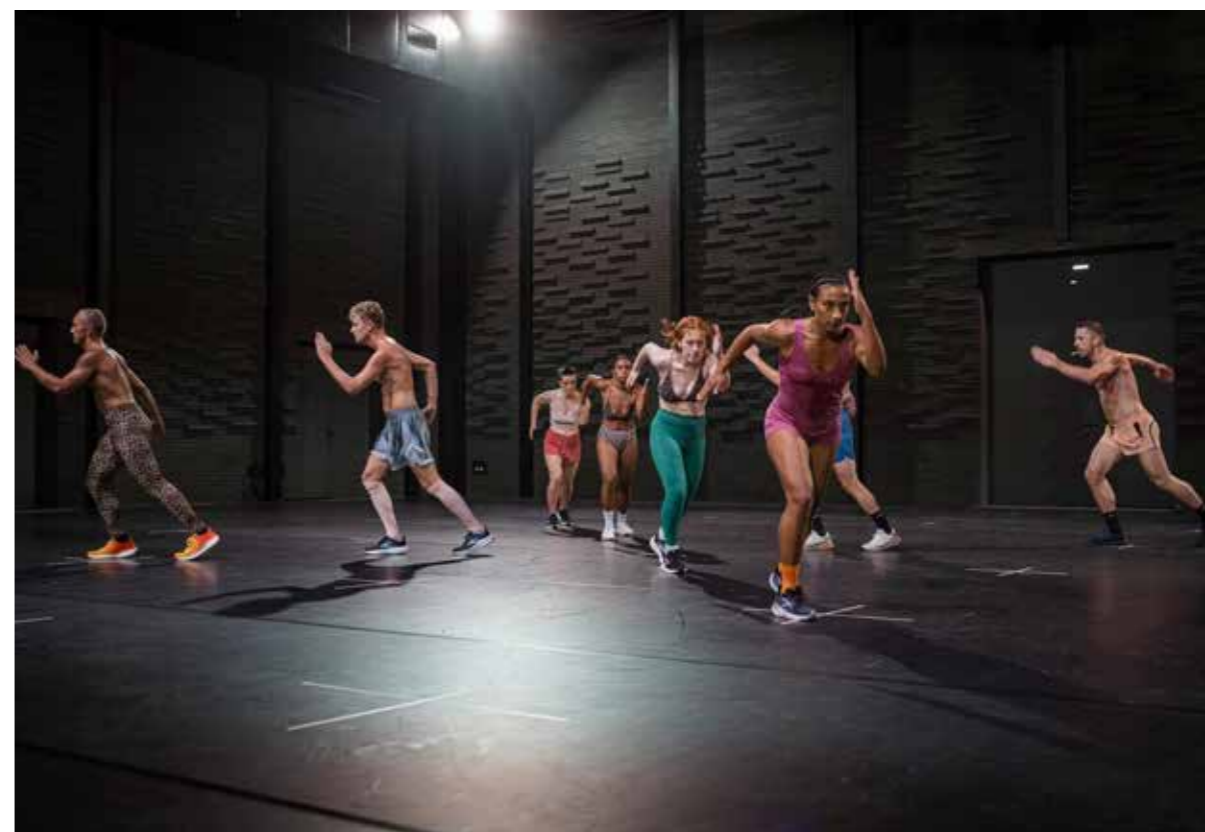
THE DOG DAYS ARE OVER 2.0, Jan Martens

Agradecimentos especiais à Rombaut Shoes pela colaboração.