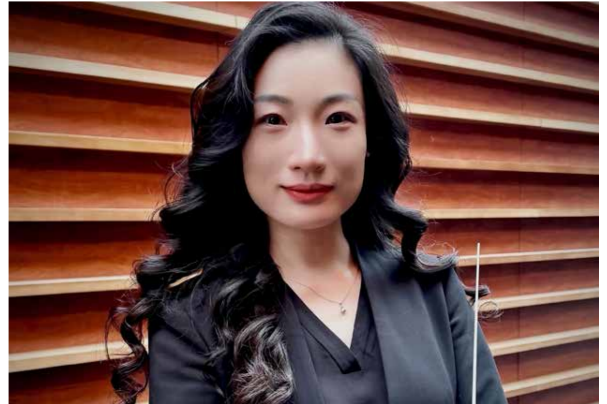
O Bolero de Ravel, Orquestra Metropolitana de Lisboa, Direção Musical Yue Bao