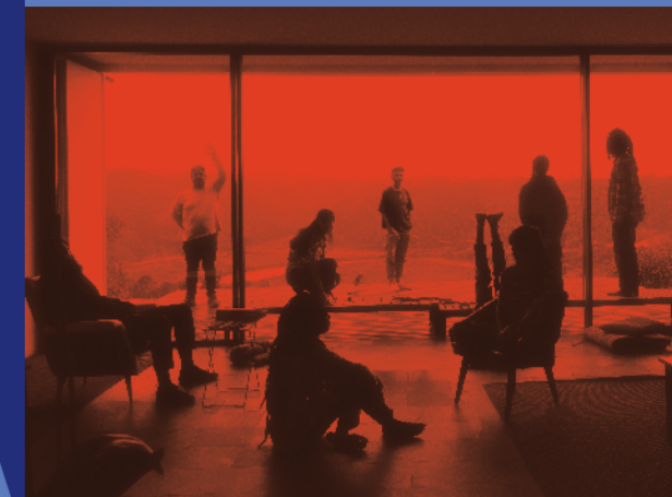
Chão Maior