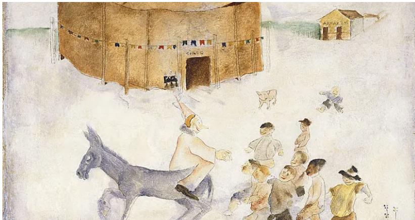
O Circo (1958)