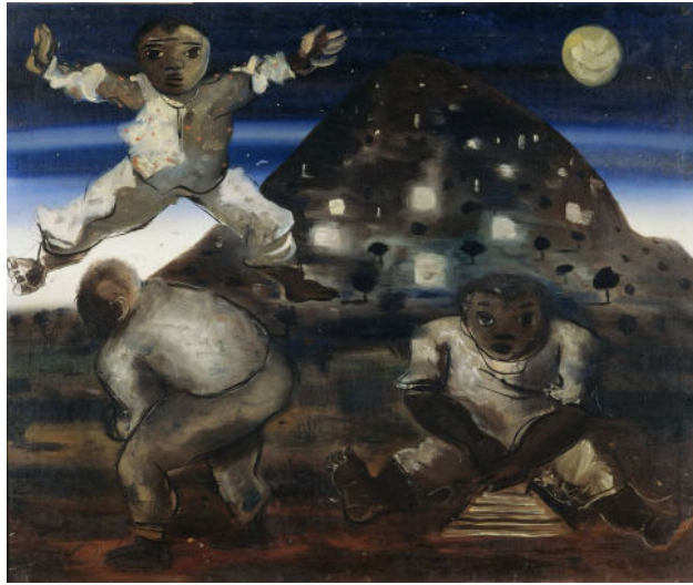
Crianças Brincando (1940)