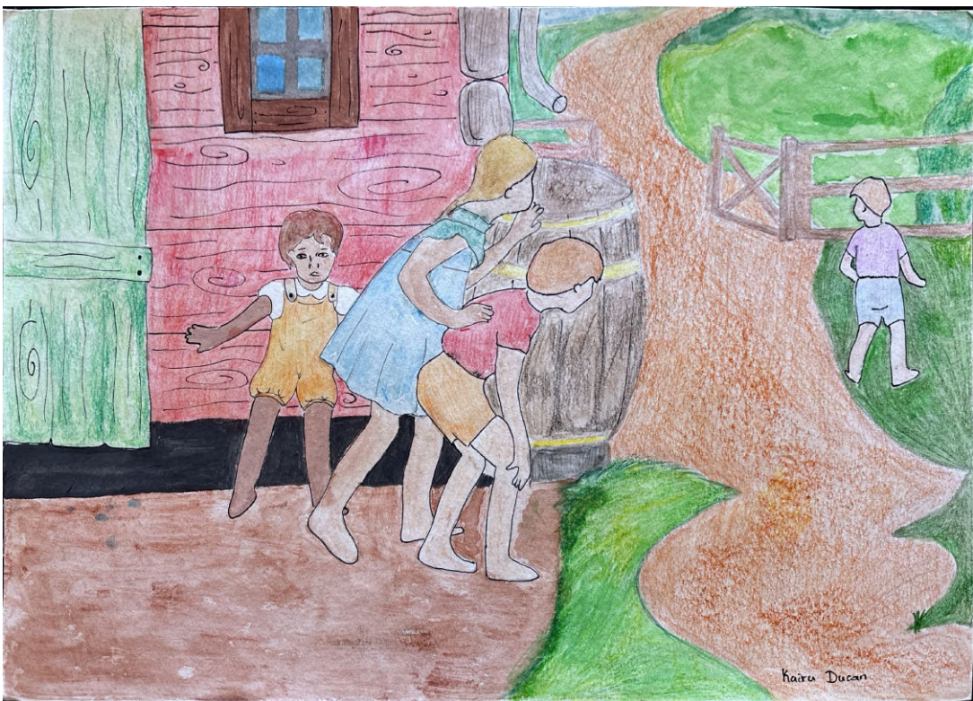
De Kaira Ducan Escola Básica das Piscinas