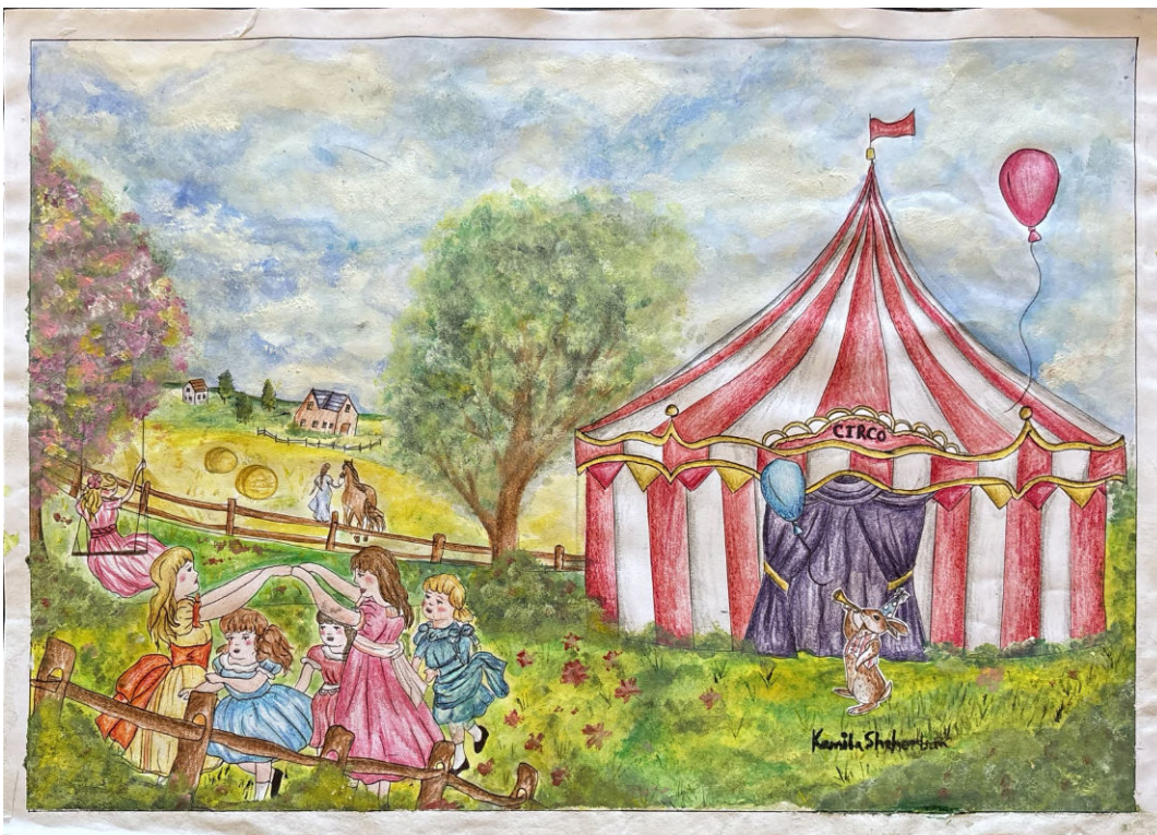
Kamila Shcherbaak – 9º C Escola Básica das Piscinas