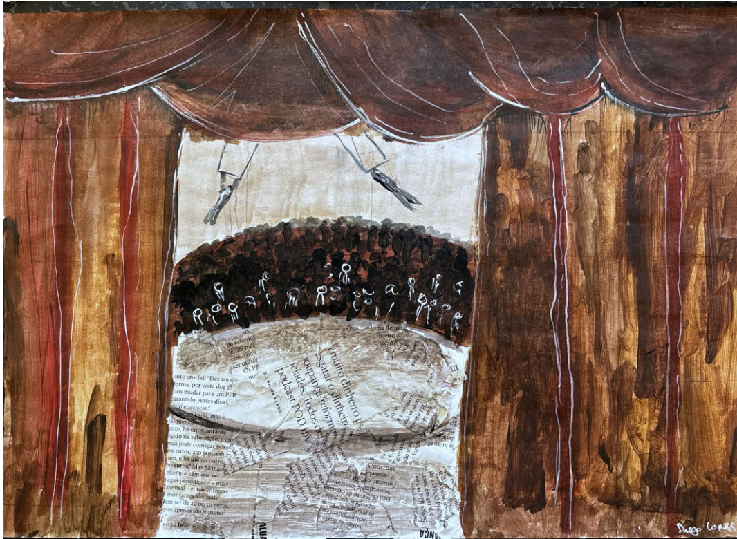
De Diogo Lopes Escola Básica das Piscinas