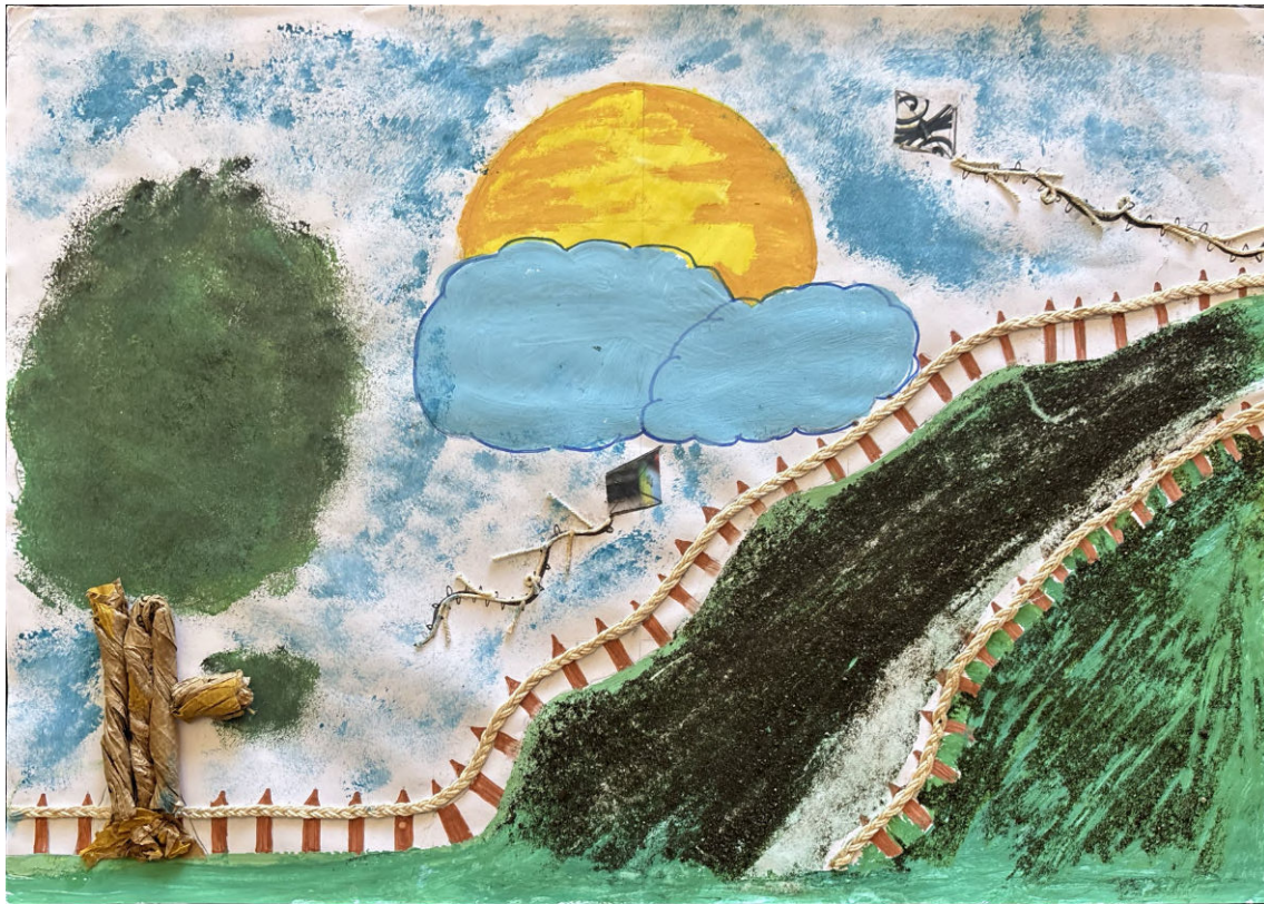
De Isabella – 7º D Escola Básica das Piscinas