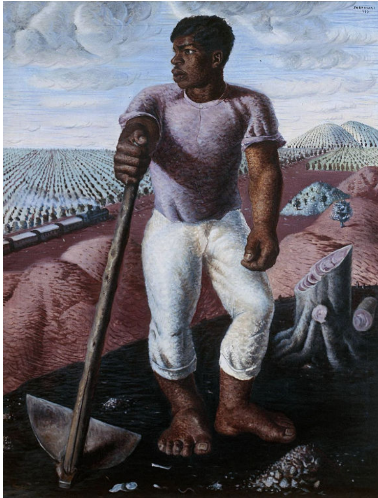
O Lavrador de Café (1934)