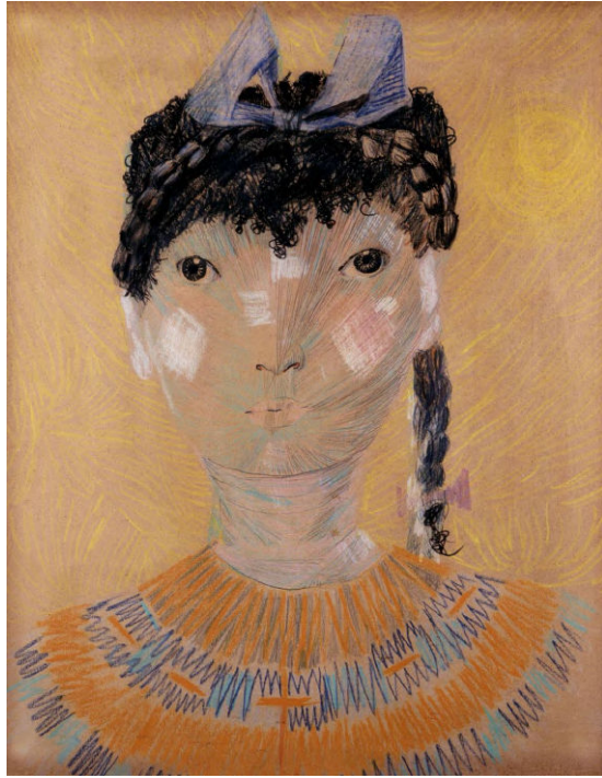
Menina com Trança e Laço (1958)