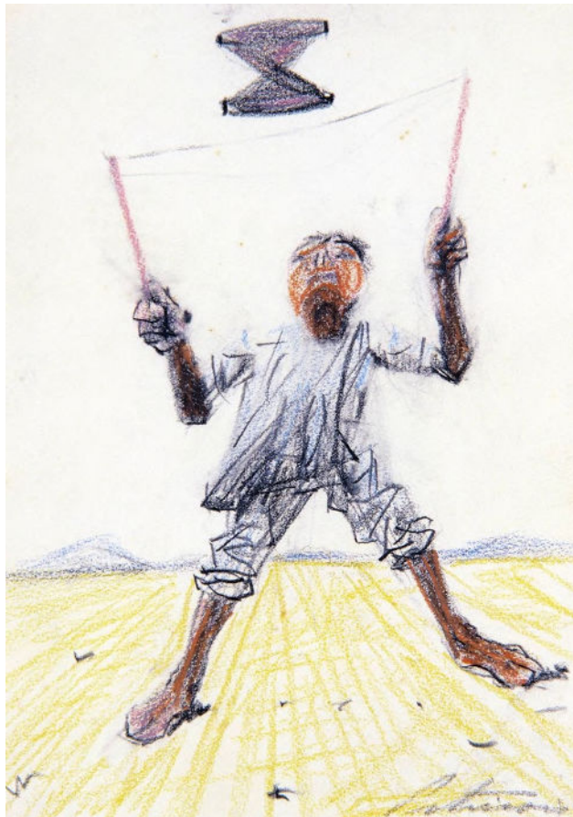
Menino com Diabolô (1955)