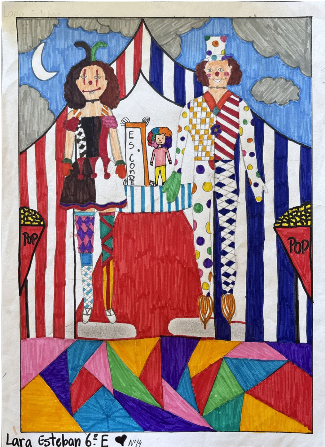
De Lara Esteban, 6º E Escola Básica das Piscinas