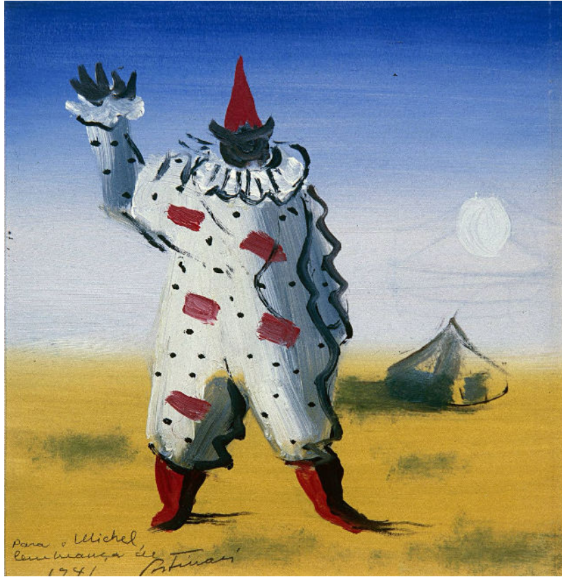
O Palhaço (1941)