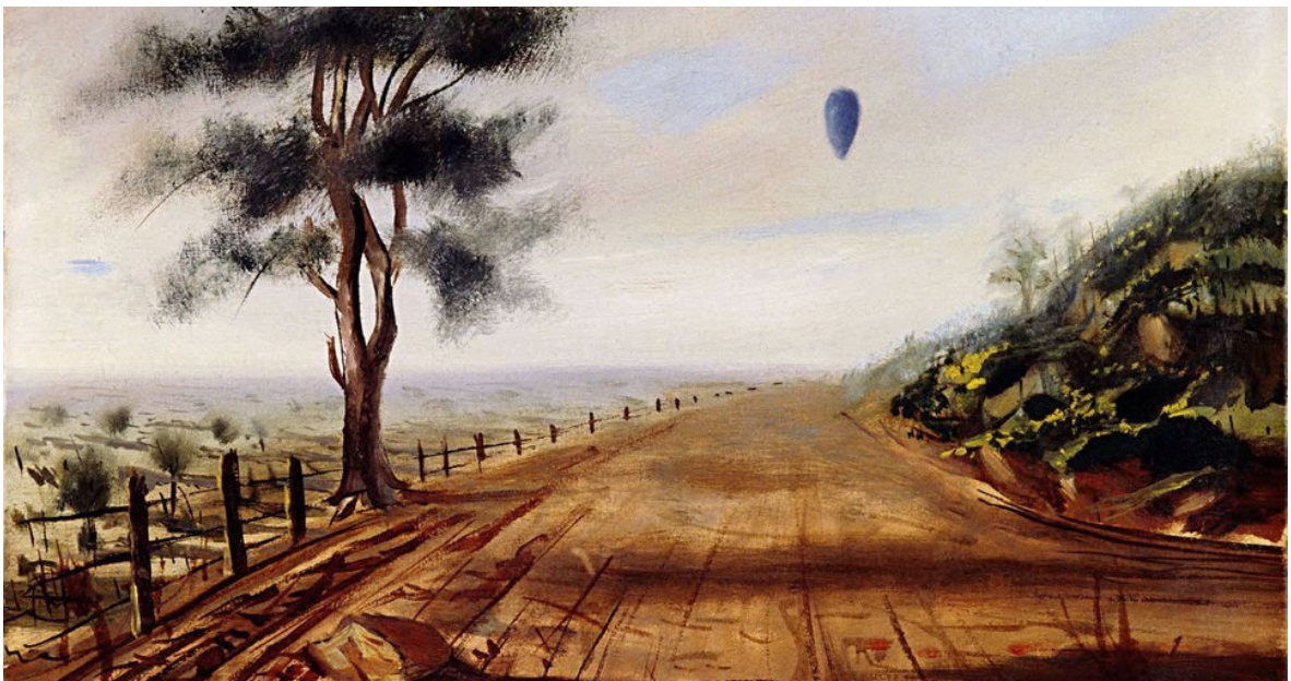
Paisagem com Balão (1958)