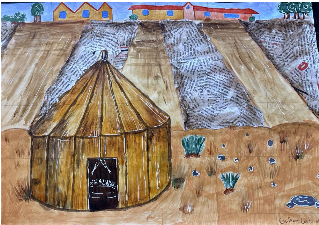
De Guilherme Costa Escola Básica das Piscinas