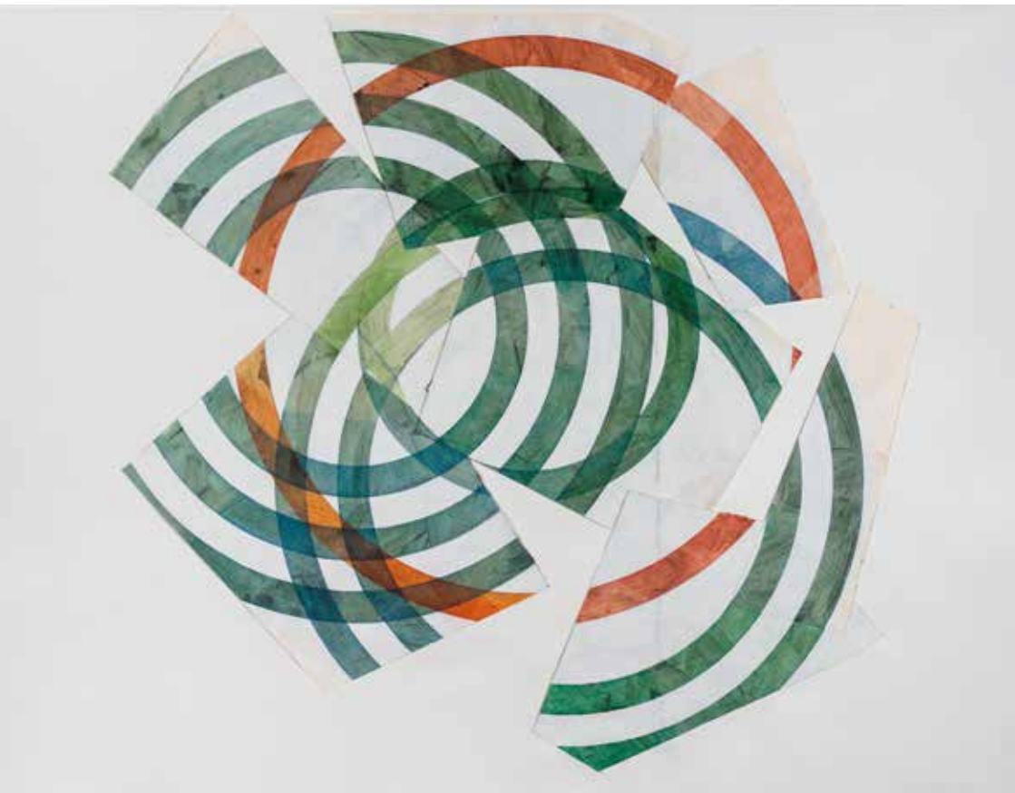
José Pedro Croft, Sem título / Untitled, 2020. Coleção dstgroup