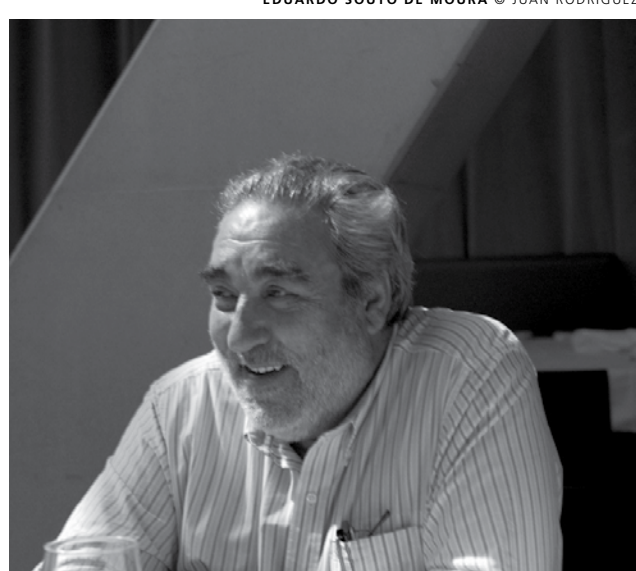
EDUARDO SOUTO DE MOURA

Eduardo Souto de Moura é uma figura incontornável do panorama arquitetónico atual cujo reconhecimento, nacional e internacional, é bem demonstrativo da relevância das influências e modelos que o acompanham e nas opções e caminhos tomados na execução das suas obras. É no campo das “imagens arbitrárias” que se deseja procurar coincidências ou dissidências, que permitam repensar uma mecânica operativa e criativa.