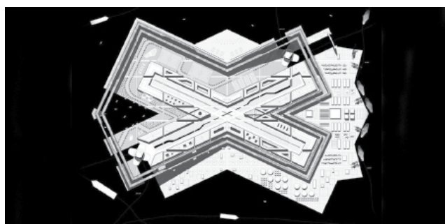
O MUNDO AOS NOSSOS OLHOS FLOATING FRONTIERS, ALEXANDER YUEN

a várias realidades urbanas, comparando metodologias e resultados; e o segundo, concentra-se em cartografia e representações de fenómenos urbanos. Baseados em descrição e análise, seguem dois objetivos: um, a operar dentro da arquitetura, procura informar o processo de projeto enquanto o segundo, procura ramificar-se para fora da disciplina e aspira a trazer outras audiências para a compreensão da cidade. As transformações da sua morfologia, as implicações das forças económicas, culturais ou políticas são alguns dos temas abordados. Convocando uma extensa lista de participantes, com projetos oriundos de vários pontos do globo, como Damon Rich do Newark Planning Office, Rualab + MAS, Cohabitation Strategies, Cities Without Ground, MAP Office, Harvard School of Design, entre muitos outros.