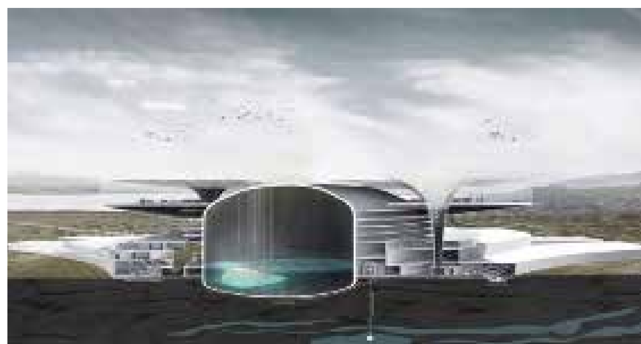
O MUNDO AOS NOSSOS OLHOS HYDROSCAPES, BLAKE STEVENSON