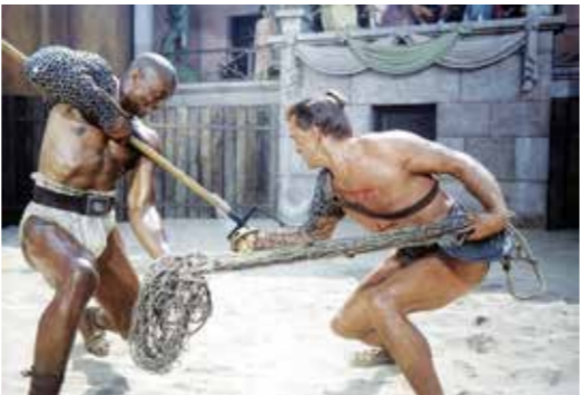
BELÉM CINEMA — GRANDE AUDITÓRIO, DIA 1, 16H