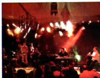
Techno Roman Project: uma festa global