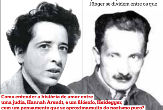
Como entender a história de amor entre uma judia, Hannah Arendt, e um filósofo, Heidegger, com um pensamento que se aproximava do nazismo puro?

Poderemos exigir a um intelectual que, para além de ser brilhante, seja consequente? Que os seus actos correspondam às (que imaginamos serem) suas ideias?