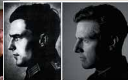
Tom Cruise e o verdadeiro Claus von Stauffenberg

O Terceiro Reich poderia ter acabado no dia 20 de Julho de 1944