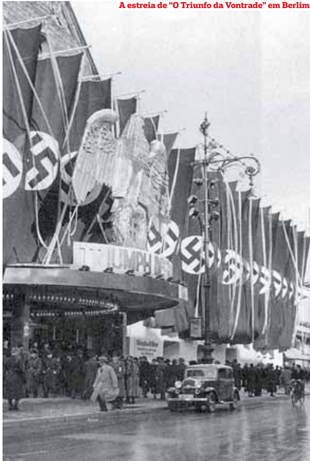
A estreia de "O Triunfo da Vontrade" em Berlim