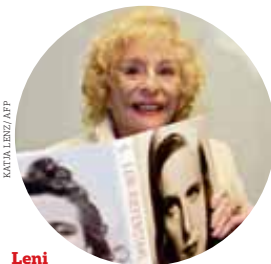
Leni Riefenstahl negou até ao fim a sua associação à propaganda nazi