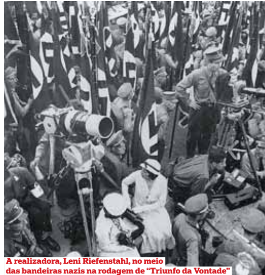
A realizadora, Leni Riefenstahl, no meio das bandeiras nazis na rodagem de "Triunfo da Vontade"

impossível não o saber - que Heidegger pertencera ao Partido Nazi, e que, enquanto reitor da Universidade de Freiburg, cargo que aceitou em 1933, afastara alunos judeus das suas aulas e recusava-se a falar com colegas judeus. Mas isso não a impediu, até ao fim da vida, de o defender. "Por paradoxal que pareça, a resposta pode estar mesmo no amor", acredita Cotrim. "Ela pode ter achado que [a ligação ao nazismo] foi um pecado, e que ele, como filósofo, devia viver retirado do mundo". A única explicação para entender esta relação é que "ela coloca-o fora da questão do nazismo, vendo-o como um velho filósofo por quem se apaixonou". E, assim, "o amor vence o nojo".