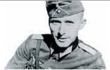
Enquanto outros intelectuais deixavam o país, Jünger não só se manteve no Exército alemão como fez parte das forças de ocupação de França

deixou a Alemanha nazi. Mas alguns - muito poucos - ficaram e, em certos casos, colocaram-se ao serviço do regime. ntes por isso? Um ciclo no CCB confronta nazismo e cultura. Alexandra Prado Coelho