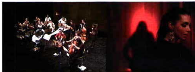
Divino Sospiro, Lisboa