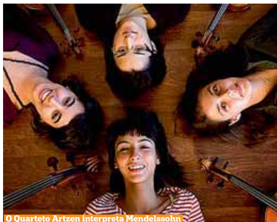
O Quarteto Artzen interpreta Mendelssohn