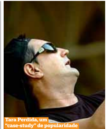
Tara Perdida, um "case-study" de popularidade