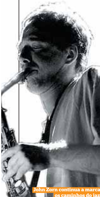
John Zorn continua a marcar os caminhos do jazz