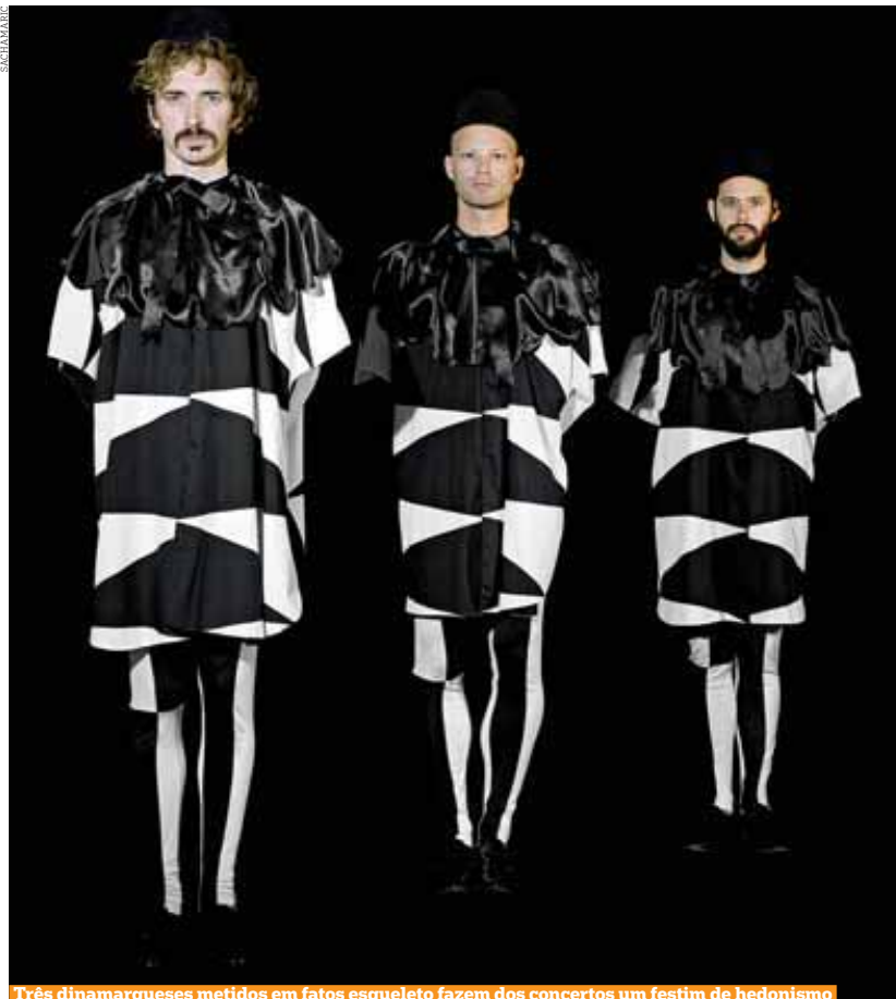
Três dinamarqueses metidos em fatos esqueleto fazem dos concertos um festim de hedonismo

No âmbito da programação dedicada ao Brasil, país tema deste ano na Casa da Música, temos o privilégio de voltar a assistir a uma actuação de John Zorn, saxofonista lendário que marcou e continua a marcar os caminhos da vanguarda no jazz. Depois de ter protagonizado, em duo com Fred Frith, um dos pontos altos do último Jazz em Agosto da Fundação Calouste Gulbenkian, Zorn surge agora associado ao