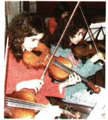
Academia de Música volta ao CCB

lém alguns dos seus alunos solistas de trompete, piano e violino (12.45, 16.15 e 19.45) e a Orquestra de Guitarras (18 horas). À imagem da edição do ano passado, o evento no CCB reunirá um vastíssimo número de pessoas, entre alunos, professores, convidados e demais público em geral, para juntos comemorem o que de bom se lecciona nas escolas de música portuguesas e principalmente fazerem deste evento uma verdadeira festa das escolas de música portuguesas.