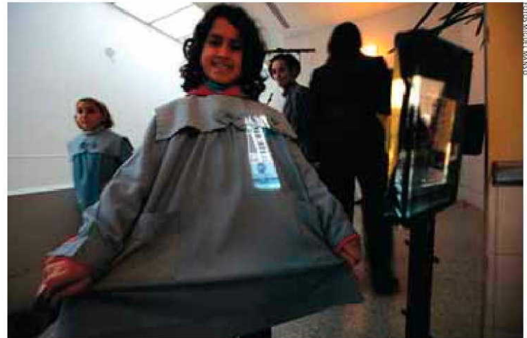
Os artistas presentes divertem as crianças, projectando algumas imagens nas suas roupas

Através de uma instalação plástica e cinematográfica, os alunos fazem uma viagem sur-