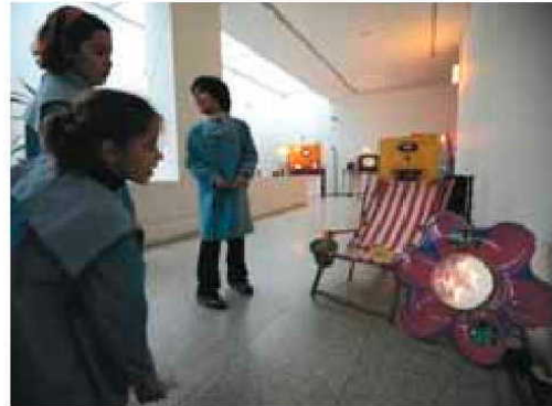
Há imagens projectadas na maioria dos objectos da exposição

realista, sustentada pelo humor. Há vários objectos onde são projectadas imagens. Num urinol há imagens de uma mulher em fato-de-banho a saltar para uma piscina, enquanto uma panela tem a projecção de uma imagem de esparguete no seu interior.