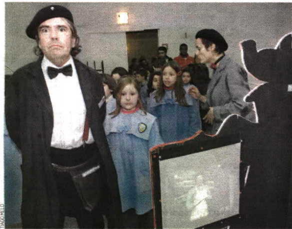
'A Vida é Super 8', instalação/exposição para crianças até dia 3

Companhia La Tortue Magique mostra como funciona o cinema